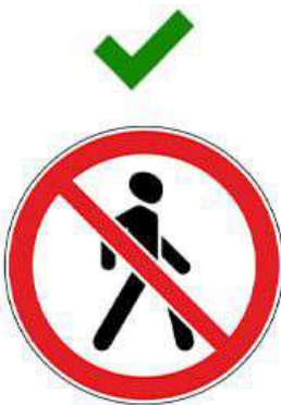
Движение пешехода запрещено